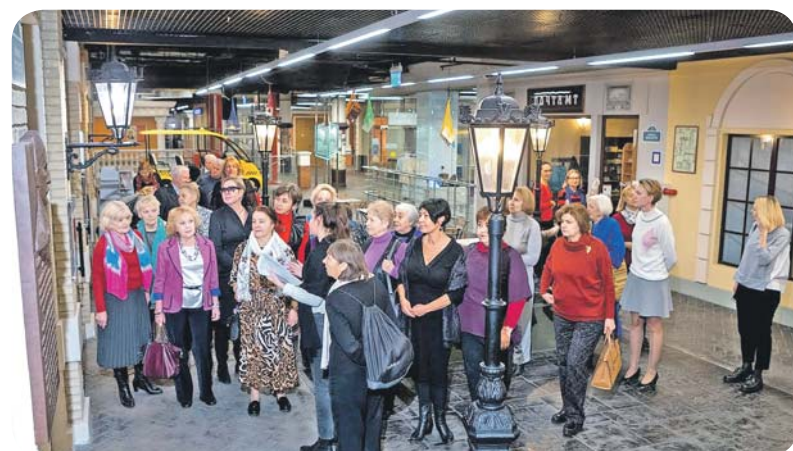
Материалы подготовила Нина ЮХНО