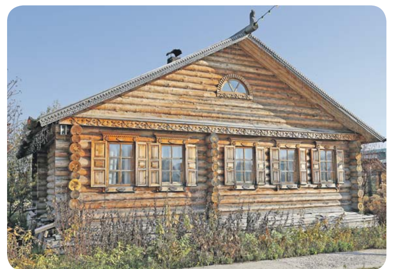
Беседу вел Вениамин ПРОТАСОВ